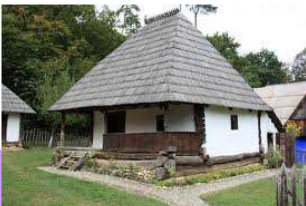
Fig. 7 Locuință - Neamț

O altă tehnică constructivă, Blokbau, ceea ce cunosc de bârne orizontale îmbinate la capete în coadă de rândunică, pe teritoriul țării noastre, primește îmbunătățiri, datorită lipirii pereților din lemn, cu lut amestecat cu paie, și pozarea acestuia atât la exterior cât și la interior îmbunătățindu-se astfel, confortul termic.