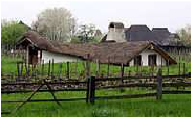
Fig. 6 Bordei - Castranova

tencuit cu lut. Suprafața de locuit varia între 6-15 m 2 .