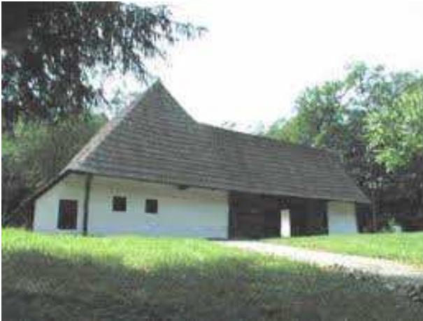
Fig. 8 Gospodărie cu ocol întărit - Măgura, Brașov

Prin dezvoltarea planimetrică, se adaugă lateral casei de locuit, chilerul , o încăpere rezultată din prelungirea cât mai în jos a acoperișului pe toată lungimea casei, în partea dinspre nord, dinspre crivăț. Rezultă un spațiu tampon, uneori împărțit în mai multe încăperi, cu acces din interiorul locuinței, sau doar din exterior.