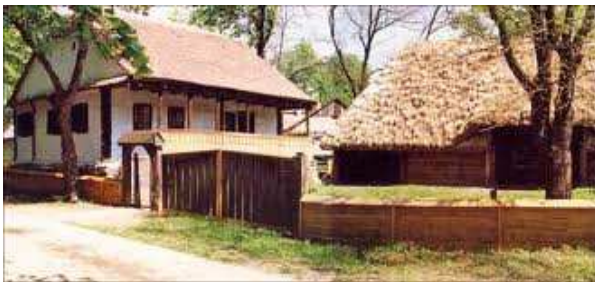
Fig. 4 Gospodărie Transilvania

asigurarea traiului de zi cu zi, fie prin agricultură, fie prin activitate lucrativă.