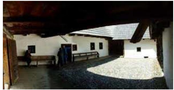
Fig. 9 Gospodărie cu ocol întărit - curtea interioară, Măgura, Brașov

Astfel, se poate realiza implementarea acestui partiu și în alte zone decât cele de origine, înțelegându-se că și arhitectura fațadelor și utilizarea materialelor, se va adapta specificului local.