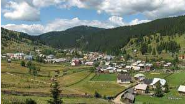
Fig. 2 Sat Bucovina

năvăliri și invazii, condițiile geografice, istorice și economice au permis continuarea permanentă a unei forme de viață stabilă legată intrinsec de păstrarea "vetrei satului".