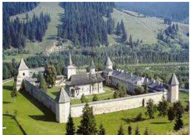
Fig. 10 Mănăstirea Sucevița

Un spațiu interior liber, delimitat de însăși clădirile locuinței sau gospodăriei creează un mediu plăcut, echilibrat, ferit de intemperii și caniculă, creează un loc de reculegere și odihnă sufletească. Și din nou ajungem la filonul poporului român: credința. Oare de ce locurile de reculegere, de rugăciune, tot într-un spațiu interior, simetric și echilibrat își desfășoară tăcute activitatea? Din nevoia de adăpost, de siguranță, ferite de priviri iscoditoare, ansamblurile mănăstirești înfloresc și azi pe ținuturile românești. Și acolo trăiesc oameni, sunt tot oameni, cu cerințe de trai mai austere și mai echilibrate în ceea ce înseamnă dorința de confort. Omul are nevoie de liniște, de contopire cu natura și cu divinitatea. Modestia unui trai monahal, își are rădăcinile înfipte adânc în modestia traiului omului de rând, de la țară.