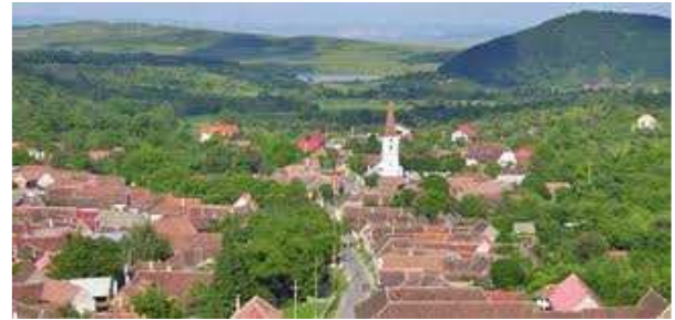
Fig. 3 Sat Mărginimea Sibiului

nucleu în jurul căreia se grupau gospodăriile țăranilor, era punctul înalt de reper de pe spinările dealurilor, era semnalul de alarmă împotriva năvălitorilor dar și întâlnirea în bucuria sărbătorilor.