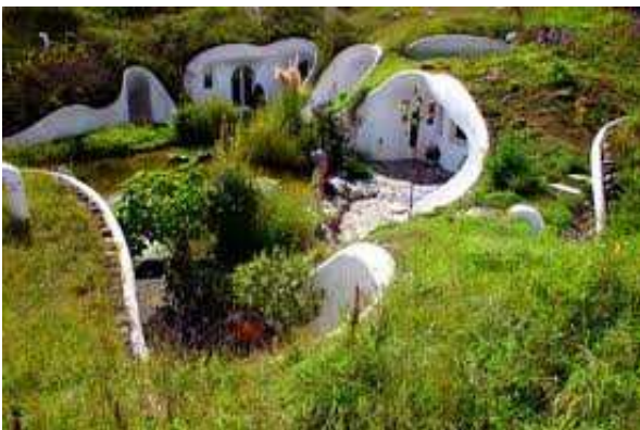
Fig. 5 Casă de pământ- ecovillage

În prezent, dacă vom prelua din tezaurul arhitecturii populare tehnicile de construire care au fost verificate secole de-a rândul, având o durabilitate verificată în timp, și aplicând în paralel principii ecovillage, care de fapt, sunt în cea mai mare parte, unitare cu cele tradiționale, toate acestea vor conduce la un rezultat mult superior, având în spate experiența generațiilor trecute.