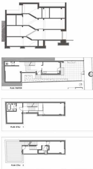
Fig. 2. Organizarea funcțională la nivel de plan și relația spațială pe verticală.

parter spațiului principal de zi, iar etajelor zona de noapte și relaxare.