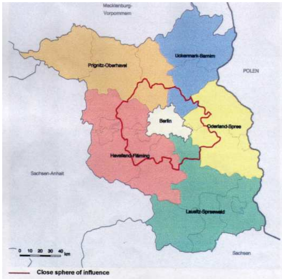
Regiunea metropolitană Berlin-Brandenburg