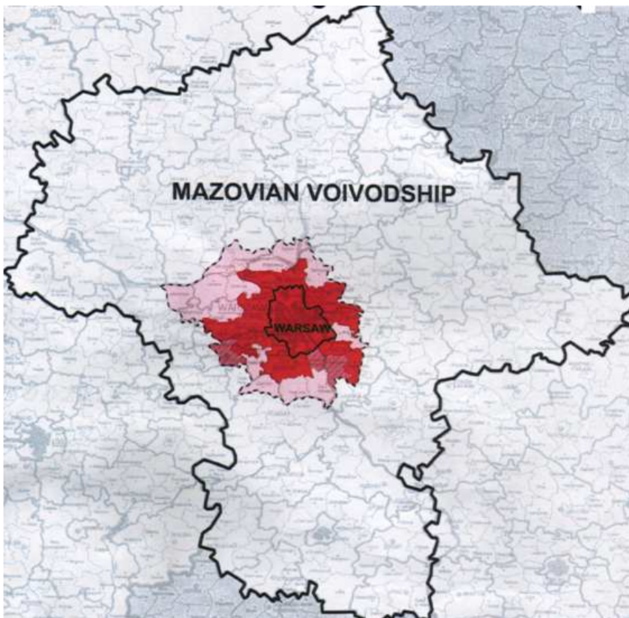
Regiunea metropolitană Varsovia