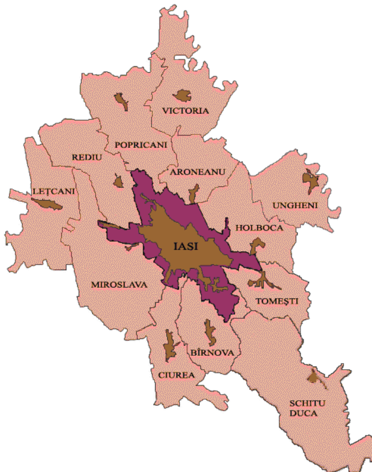
Zona metropolitană Iași